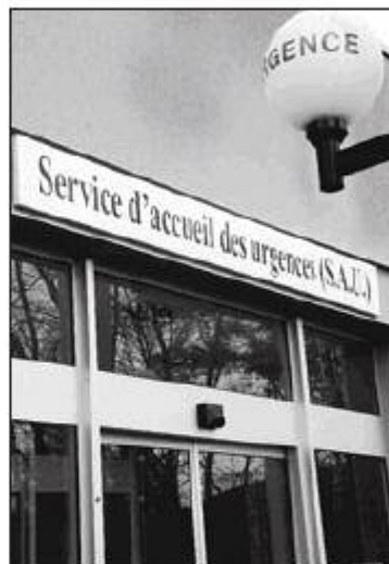
En 2007, le service des urgences de Forbach a enregistré 22 000 passages. Chaque jour, trois médecins sont de garde, deux pour le Smur, et un sur place.

trer que notre profession est concernée pour que le gouvernement s'intéresse à nous. » Alors, les médecins envisagent déjà de nouvelles actions. Ils seront toujours fidèles à leurs patients.